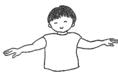
ちゅんちゅんちゅん