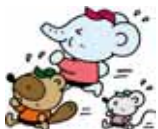
かけこの練習 ゴールテープまで頑張って走りまし 0歳児のつどい お母さん同士、色んな話をして過ごしました。