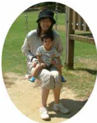
公園で遊ぼう 金魚と鯉の郷公園で遊びました！

朝夕の風に冷たさを感じるこのごろ、気付けば、もうすぐ立冬ですね。園庭の木も赤や黄色に色づき、美しい秋の自然が広がっています。秋は、どんぐりやマツボックリなどの自然物を使った造形活動を用意していますので、是非お出かけください。