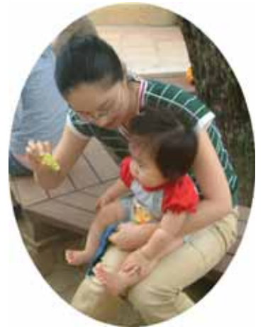
シャボン玉 そ〜っと吹いてとばしました！！