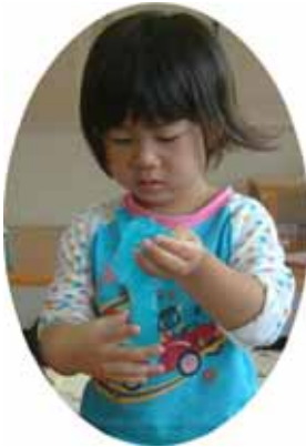
スライム作り 感触を楽しみながら遊びました。