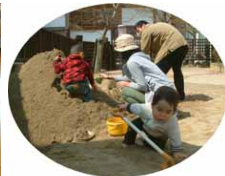
園庭開放 平日のお昼まで園庭で自由に遊べます。砂場で大きなトンネルを作りました！