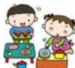
1歳児親子のつどい 遊ぶ姿が真剣！！ペットボトルで実験中！