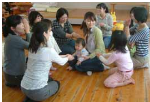
わらべうたのつどい 色んなわらべうたで遊びました