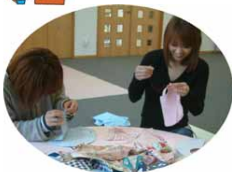
余った布や着なくなった服を再利用してスタイを作りました！