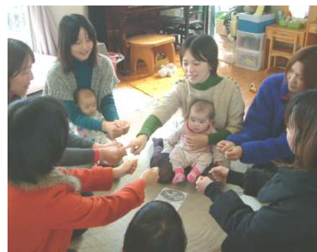
☆わらべうたのつどい☆ お正月のわらべうた遊びをしました！