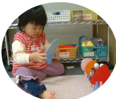
せんたくバサミも上手に 使えるよ！！