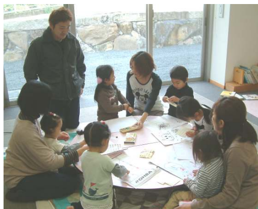
クレヨンで絵を描いて遊びました！！