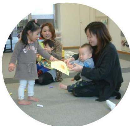
誕生会☆1月生まれのお友達 に誕生カードのプレゼント♪