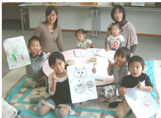
出来上がり☆かわいく描けたでしょ！？