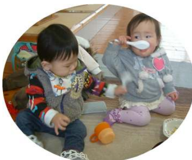
☆1歳児親子のつどい☆ おいしくできたかな～？？