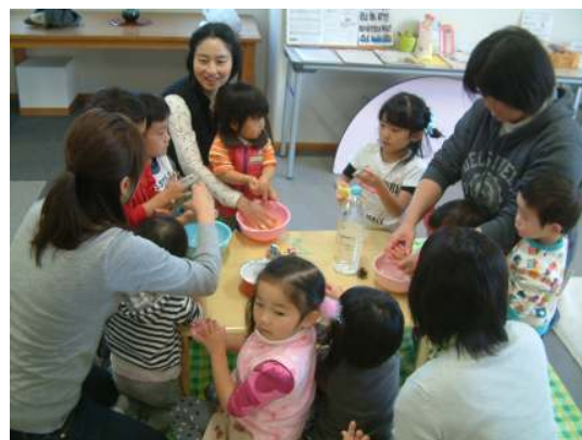
小麦粉粘土を作って遊びました☆