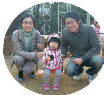
鏡開きで、おもちを焼いて食べ ました。焼きたてのおもちは、 おいしいね☆