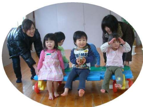
☆2歳児以上親子のつどい☆ ジャンボブロックで車を作りました！

今月は、豆まきをします。節分で福をよぶと共に、心の中のいろいろな鬼を退治しましょう！