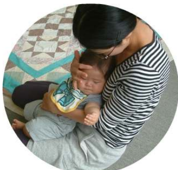
わらべうたのつどい♪