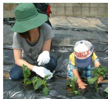
畑に芋の苗を植えました！！今年は、いつもより沢山の苗を植えたので収穫が楽しみです♪