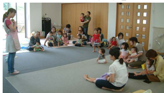
☆誕生会☆エプロンシアターがありました。