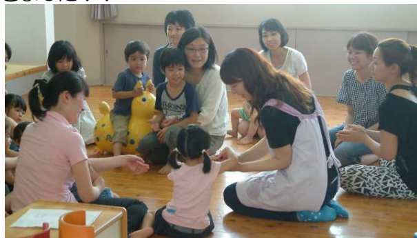
☆わらべうたのつどい☆ 七夕のわらべうたで遊びました♪