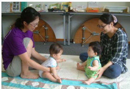
☆0歳児親子のつどい☆ 「お座りの仕方を教えて～」

梅雨も明け、いよいよ夏本番！！雲の様子や、自然の変化を子ども達と一緒に感じたいですね。 汗をかいて遊んだ後は、プールで汗を流して水遊びを満喫しましょう！！