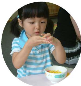
☆小麦粉粘土で、野菜を作って遊びました☆