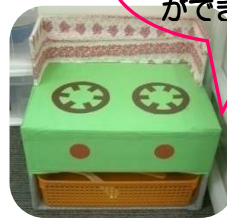
台所コーナーにガスコンロができました