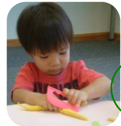
小麦粉 ねんど作り