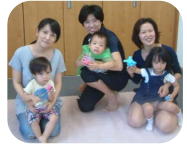
2歳児以上のわらべうた「うたったで賞」の入賞者☆