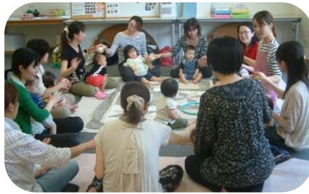
0,1歳児のわらべうたのつどい♪