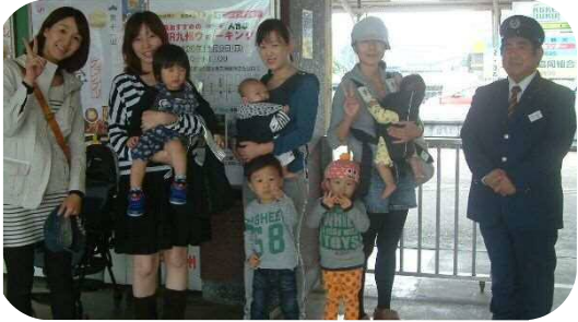
玉名駅へ電車の見学に行ってきました！ 歩道橋の上から電車を見ました☆

日中は、暖かい日がさしこむものの朝晩は本格的に冷え込むようになりました。今年も残すところ後わずかです。体調をこわさず元気に新年を迎えたいですね！！今月は、お楽しみ会を計画しています。お父さん、お母さんの色んな出し物があり、今年も楽しくなりそうですよ！