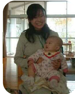
プレババプレママ学級☆赤ちゃんを抱っこしてみたり、沐浴の練習、先輩ママの話等があり楽しい時間を過ごしました。