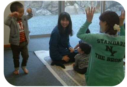
2歳児のわらべうた☆ 上手にキツネになれてるでしょ？！