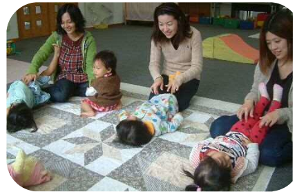
1歳児のわらべうた♪子ども達も気持ち良さそうでした！