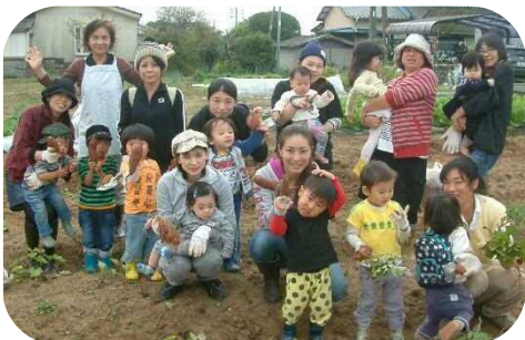
芋ほり☆土の中から芋が見えると、子ども達は大喜び！ その後は、お母さん達が一生懸命掘ってお土産にしました！