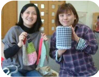
ポコポコクラブ（妊婦さんのつどい）☆ 縫い物をしながら先輩ママの自宅出産の話をお聞きしました。