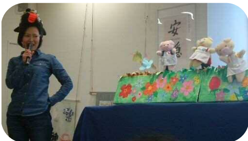
「三匹のこぶたの人形劇」