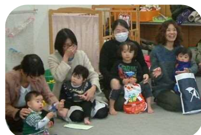
☆全員でのプレゼント交換☆