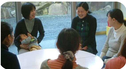
☆2歳児以上親子のつどい☆ 子育てについてゆっくりお話をしました。