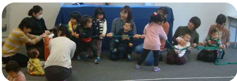
出身地の方言でセリフを話す「大きなかぶ」

☆お楽しみ会☆ 今年もお父さん、お母さんによる楽しい色んな出し物が沢山ありました。