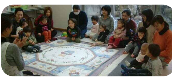
☆誕生会☆ 1月生まれのお友達のお誕生日をお祝いしました。