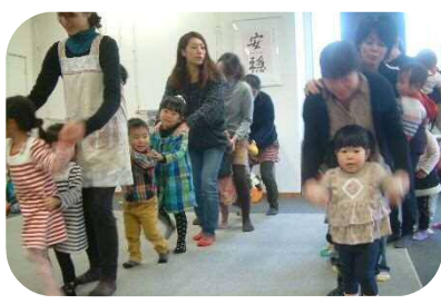
☆リトミック☆ 音楽に合わせて体を動かしたり動物になりきって遊びました。