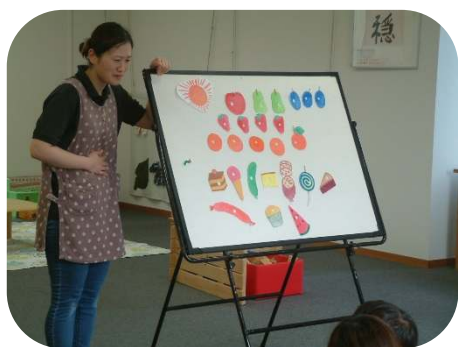
☆誕生会☆『はらぺこあおむし』の パネルシアターを楽しみました。

日中は、まだまだ暑い日が続き、子ども達の水遊びが気持ちよさそうです。これからの季節、赤トンボがとんだりコオロギが鳴いたり、秋を感じる季節になりますね。朝夕と日中との気温差で体調を崩さないように気をつけましょう。