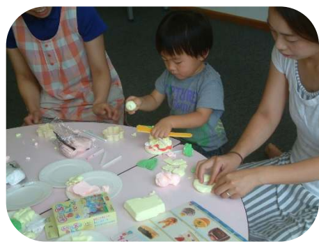
☆2歳児以上親子のつどい☆ 粘土で食べ物づくり。おいしそう！