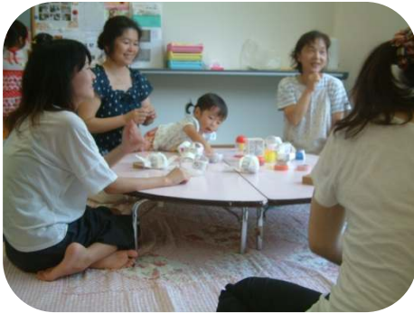
☆1歳児親子のつどい☆ 牛乳パックでボール&コマづくり！