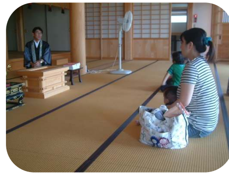
敬愛保育園の本堂で、話をききました。