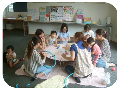
☆0歳児親子のつどい☆ ホース落としや音の鳴るおもちゃを 作りました。