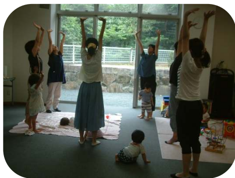
♪わらべうたのつどい♪ お母さんとのわらべうた遊びに、子どもたちもニコリ♡