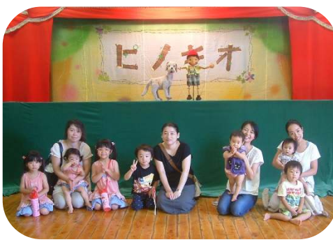
プロの方による人形劇『ピノキオ』