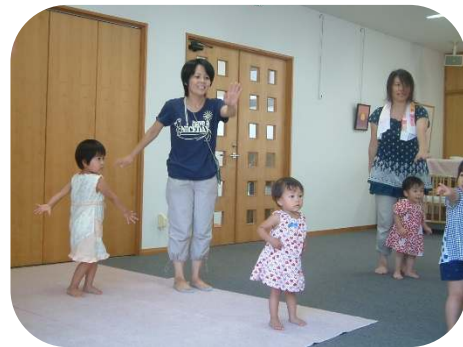
盆踊りの練習中！可愛いくさで 踊っています。