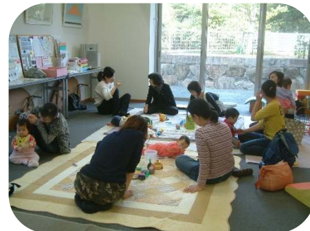
0歳親子のつどいでは、育児相談と身体測定を行っています。