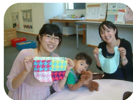
☆ポコポコくらぶ☆ 手作りのスライを作りました。