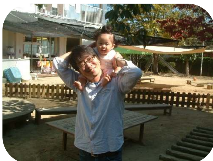
お父さんと一緒に♡