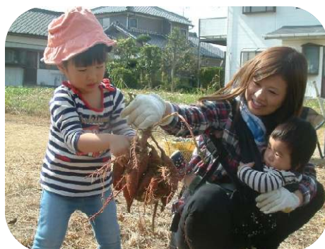
頑張ってお芋を掘ったよ！