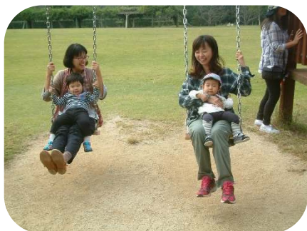
金魚と鯉の郷公園でのびのびと遊びました。

美しい紅葉の時期も終わり、冬の訪れを感じますね。早いもので、今年も残すところ後わずかとなりました。今年最後の思い出にお楽しみ会を計画しています。皆さんで楽しい時間を過ごしたいと思っておりますので、ぜひ、お出かけ下さい。