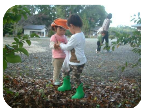
ドングリみつけたよ！