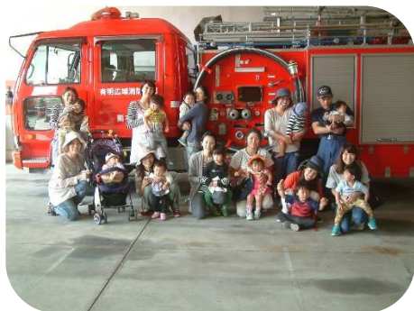
☆消防署までお散歩☆ 本物の消防自動車や救急車に乗せてもらいました。