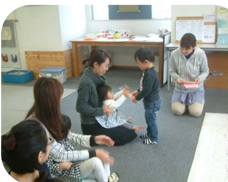
☆誕生会☆ おたんじょうびおめでとう！