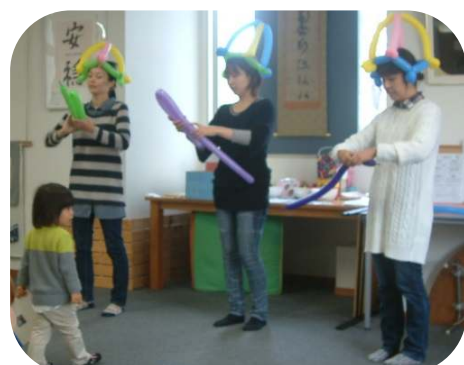
☆お楽しみ会☆ 皆さんと楽しい時間を過ごしました