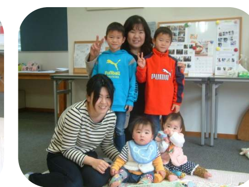
ピースくらぶ（双子のつどい）