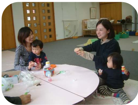
1歳児・2歳児親子のつどいで、音の鳴る玩具を作りました。

もうすぐ立春です。春の到来が待ち遠しくなってきました。 今月はメープル広場に鬼がやってきます！豆をまいて、福を呼び込むとともに、心の中の鬼を退治しましょう。戸外で体を動かして、細めにうがい手洗いをしながら、元気に過ごしていきたいですね。