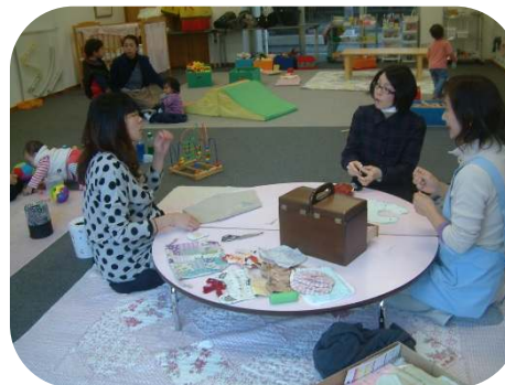
話をしながら、手作りの物をつくりました。