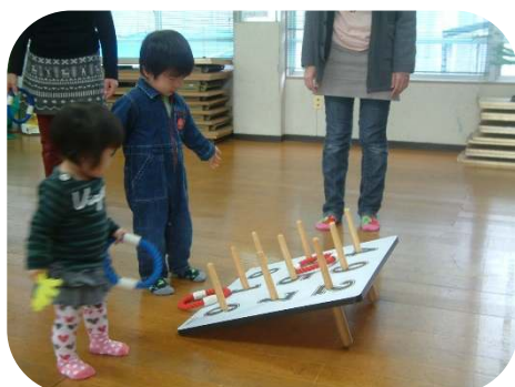
ぬかみねキッズのお楽しみ会