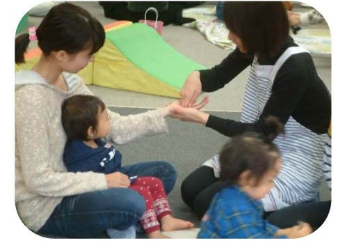
わらべうたのつどい ♪イッチクタエモンサン♪