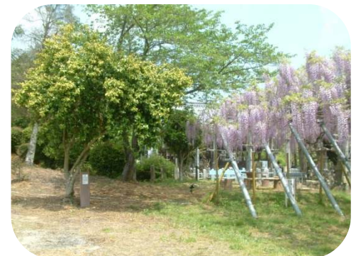
藤の花の隣には、バナナの香りのする木があります。