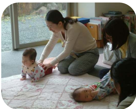
わらべうた♪いちり、にり、さんり～