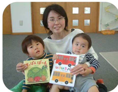
☆絵本の読み聞かせ☆『すっぽんぽーん』 『いろいろバス』