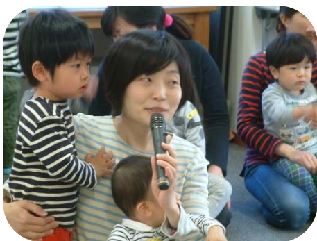
☆入園お祝い会☆インタビューもありました

園庭の木々にもやわらかな若葉が見られるようになりました。今月は、お母さんがリラックスできるような体操や、ご家庭で遊べる玩具を作るプログラムなどを用意しておりますので、ぜひ、気軽にお出かけ下さい。