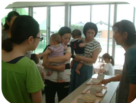
離乳食の展示と話