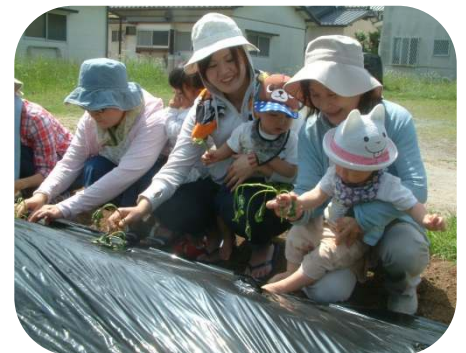
☆芋の苗植え☆大きくな〜れ!