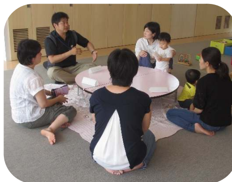
池松さん（玉名市心理相談員） との井戸端会議