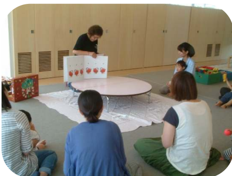
親子で楽しむ絵本セラピー