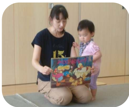
☆誕生会☆ お母さん方による紙芝居やエプロンシアター

梅雨空が続きます。大人も、子どもも体力を消耗しやすくなりますので、しっかり水分補給をして休息をとるようにしたいですね。プールも開放していますので、体調管理に気をつけて、夏の遊びを楽しみましょう。