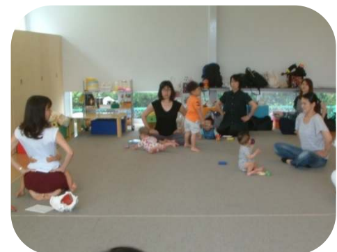
骨盤底筋体操でリラックス