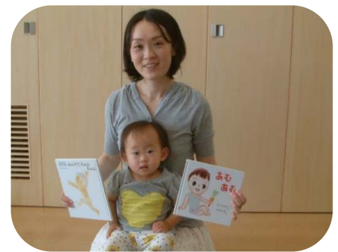
お子さんがお気に入りの 絵本の読み聞かせをしていただきました