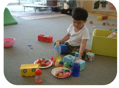
お弁当を作ってピクニック