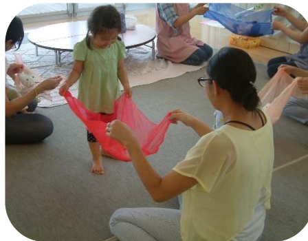
お母さんと一緒に♡