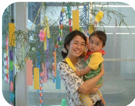
七夕の飾りつけ☆短冊にお願い事を書いて飾りました。