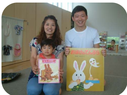
☆お父さんの絵本の読み聞かせ☆ 素敵な絵本を紹介して頂きました。