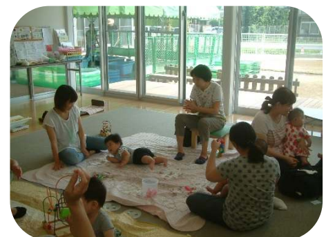
大山さん（助産師）との 0歳児親子のつどい