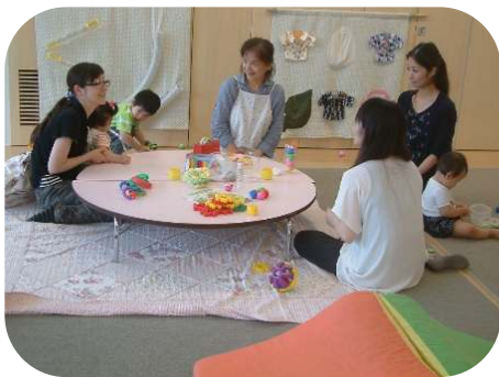
1歳児親子のつどい

梅雨があけると、いよいよ夏本番！セミの鳴き声も力強くなりましたね。 暑くなってくると、水遊びも更に楽しくなりますね。水分補給と休息をとりながら、夏の遊びを満喫しましょう。