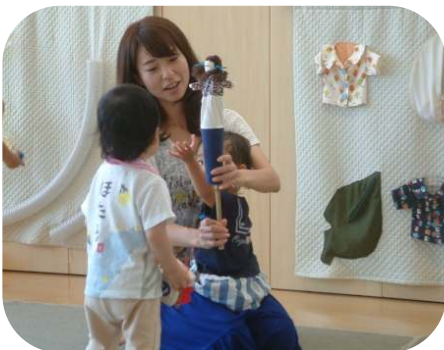
お母さん手作りのスッパポン人形 でわらべうた♪