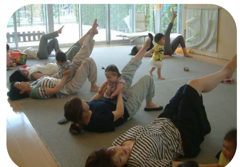
骨盤底筋体操でリラックス