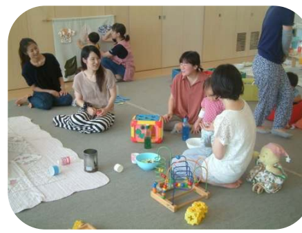
☆1歳児親子のつどい☆