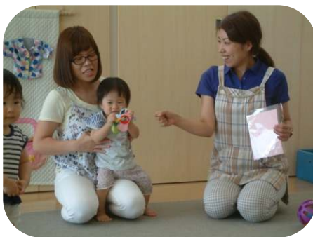
7月生まれの誕生会♪ ☆お誕生日おめでとう☆