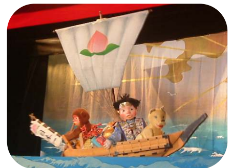
ぱれっと人形劇 『ももたろう』