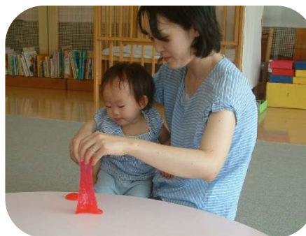
☆スライム作り☆ こんなにのびたよ～♪