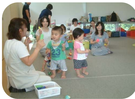
1歳児わらべうたのつどい