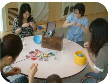
手作りおもちゃ（お手玉作り）

まだまだ暑い日が続きますね。水遊びもそろそろ終盤です。 これから朝夕が涼しくなってきますが、日中との気温差で体調を崩さないように気をつけましょう。