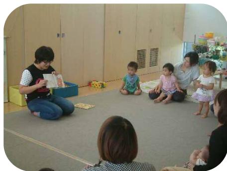
☆絵本の読み聞かせ☆