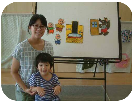
☆8月の誕生会☆『三匹のこぶた』 を演じていただきました。

秋の戸外は、木の実や落ち葉など子ども達にとって、魅力的な遊び道具がいっぱいです。色んな自然に触れていきたいですね。今月も楽しいプログラムを用意していますので、是非お出かけ下さい。