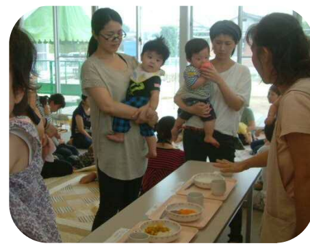
離乳食の話・展示