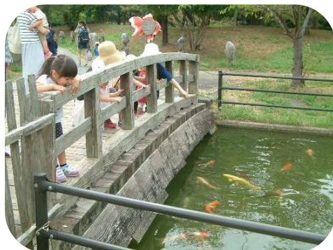
金魚と鯉の郷公園に行ってきました。