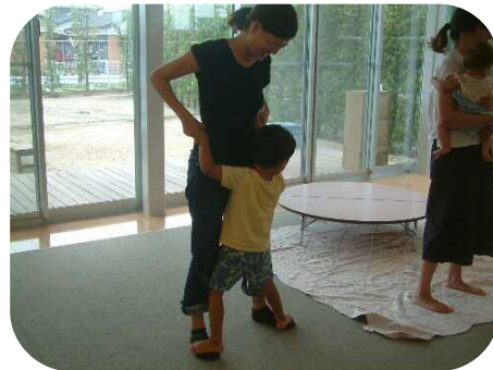
わらべうたのつどい♪