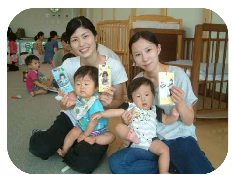
敬老の日のプレゼントに しおり作り