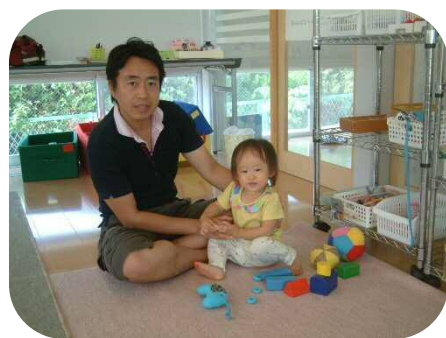
お父さんと一緒に♪