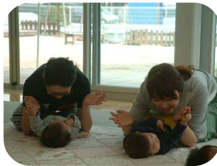
お母さんと一緒にわらべうたを楽しみました