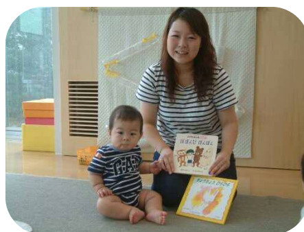
☆絵本の読み聞かせ☆