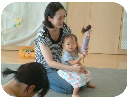
ママお手製のすっぺらぼん人形☆