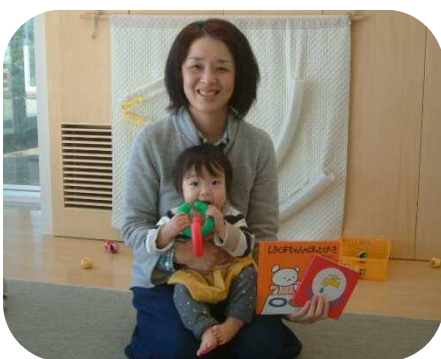
☆絵本の読み聞かせ☆