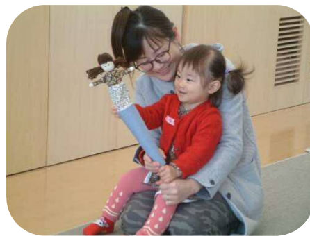
お母さんと一緒にわらべうた遊び♪