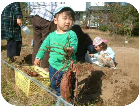
大きなおいもが掘れたよ！！