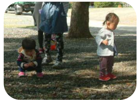
どんぐりどこかな～