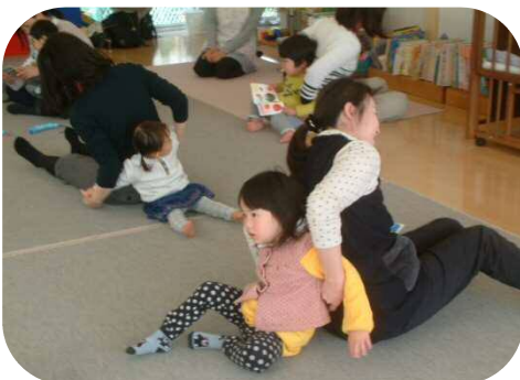
わらべうたのつどい♪