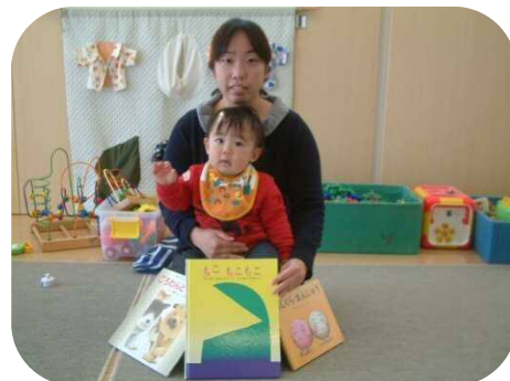
お子さんが大好きな絵本を紹介していただきました