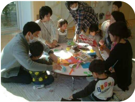
個性豊かな鬼のお面が出来上がりました

木々の芽が膨らみ、寒さの中にも春の訪れを感じるようになりました。戸外遊びも気持ちよくなる季節になりましたね。今月も、入園お祝い会やお花見など、楽しいプログラムを計画しておりますので、是非、お出かけ下さい。