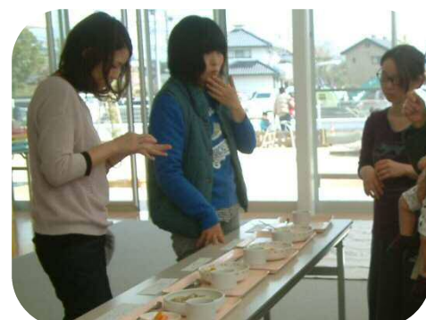
0歳児親子のつどい☆離乳食の展示