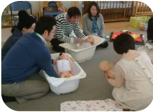
プレパパ・プレママ学級で沐浴の練習

寒さも少しずつ和らぎ、ポカポカとした春の陽気を感じられるようになりました。 戸外で遊ぶことが気持ちの良い季節となりましたね。自然に触れながら、一緒に春を見つけましょう。