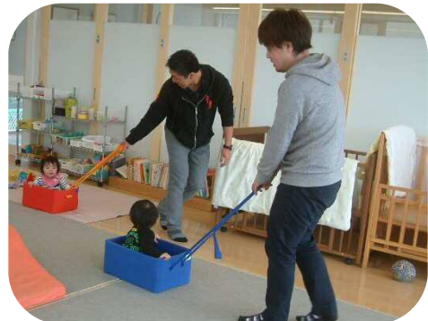
お父さんと遊びました