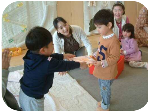
お誕生日おめでとう！