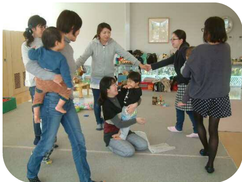
わらべうたのつどい♪