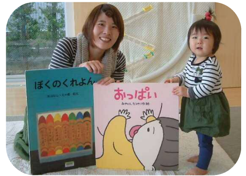
大型絵本を読んでいただきました