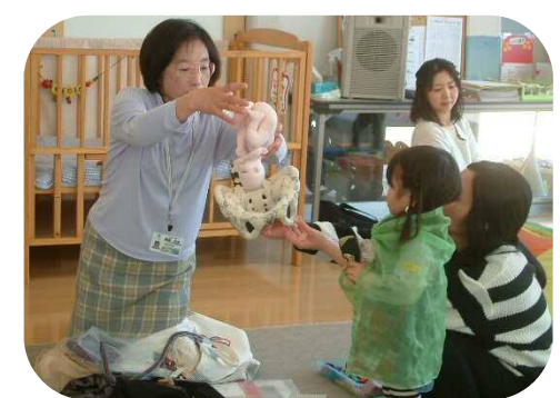
乳幼時期の性についてのお話