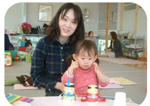
可愛い雛人形を作ったよ♡