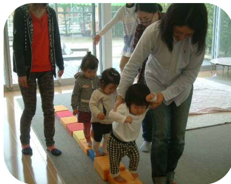
どんどんばし わたれ～ さあ わたれ～♪