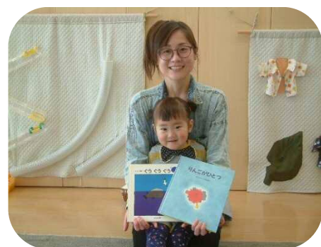
☆絵本の読み聞かせ☆ 『ぐうぐうぐう』『りんごがひとつ』