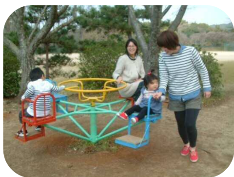
四十九台公園で遊びました♪

園庭の木々にもやわらかな若葉が見られるようになりました。今月は、ご家庭で遊べる玩具を作ったり、親子で楽しめるプログラムなどを用意しておりますので、ぜひお気軽にお出かけ下さい。