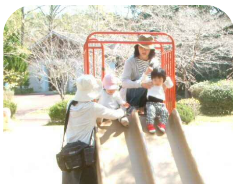
蛇ヶ谷公園でお花見☆