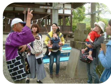
藤保存会の方から、藤についての説明をしていただきました。