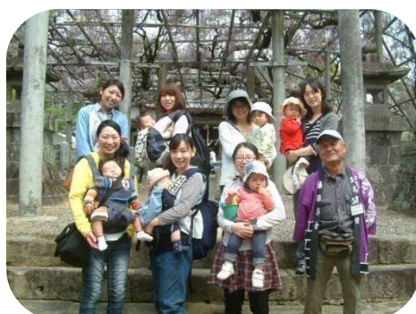
☆山田の藤見学☆ きれいな藤を見ながら、皆で お弁当を食べました。