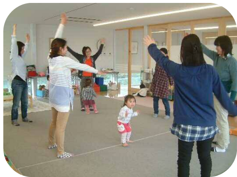
1才児わらべうた♪お母さんも 体を動かしてリフレッシュ!