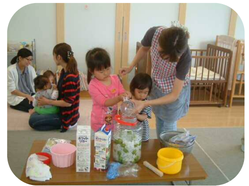
瓶に、梅と氷砂糖を交互に入れて…あとは出来上がりを待つだけ！楽しみです ☺