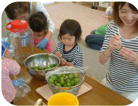
竹串を使って、ヘタを取ります☆