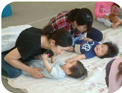
《0歳児わらべうたのつどい》