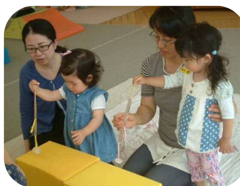
1歳児以上わらべうたのつどい★ ♪どんどんばしわたれ さあわたれ〜♪