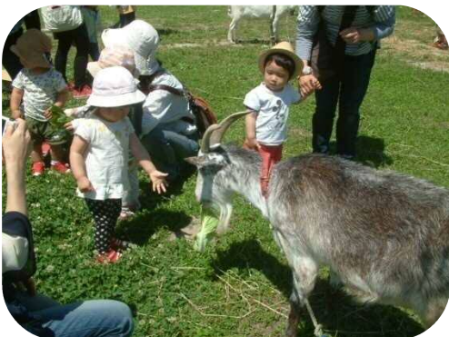
ヤギを見に行きました☆ 餌やりを楽しみながら、ヤギとたくさんふれあいました♡