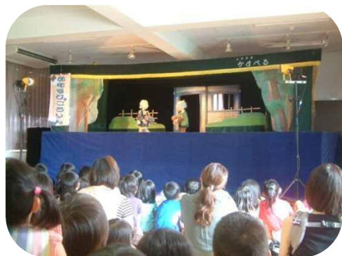
☆かすべる人形劇☆ 『おむすびころりん』

まだまだ暑い日が続きますね。水遊びもそろそろ終盤です。 これから朝夕が涼しくなってきますが、日中との気温差で体調を崩さないように気をつけましょう。