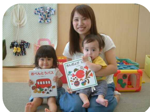
☆絵本の読み聞かせ☆ お子さんが大好きな絵本の紹介していただきました。