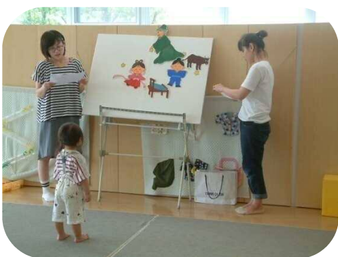
お母さん方が七夕のお話をしてくださいました！