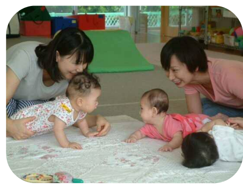
0歳児わらべうたのつどい★ 見つめ合う姿に癒されますね♡