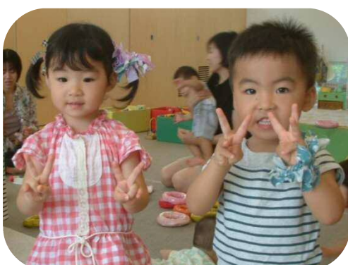
可愛いシュシュが出来たよ♡