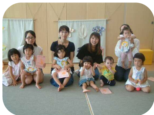
☆誕生会☆ 7月生まれのお友達で～す♪