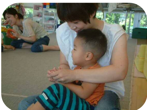
1才以上わらべうたのつどい♪ お母さんと手遊び(*^_^*)