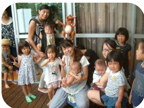
最後にたぬきさんと♪