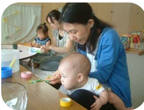
『手作りおもちゃのつどい』 水遊びで使えるおもちゃを作ったよ😊