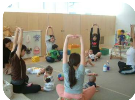
『骨盤底筋体操』 様々なストレッチで心も身体も リフレッシュ♡