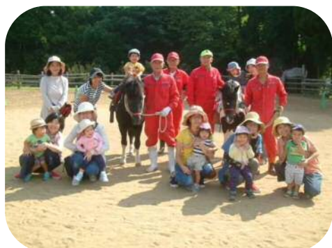
立願寺ポニー公園へ行ってきました♪