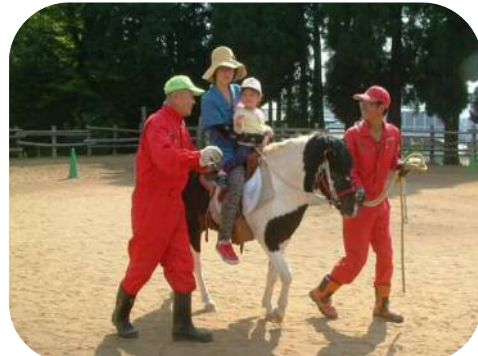
ポニーに乗ったよお～！！