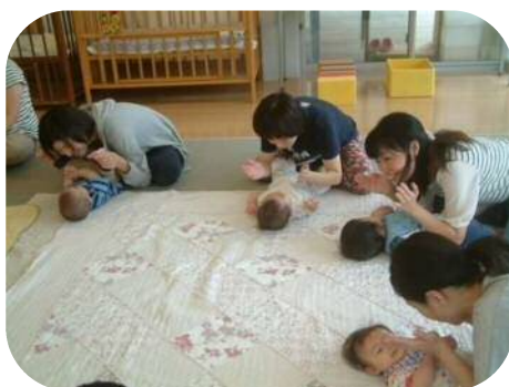
0歳児わらべうたのつどい♪ いないいない～い、ばあ！