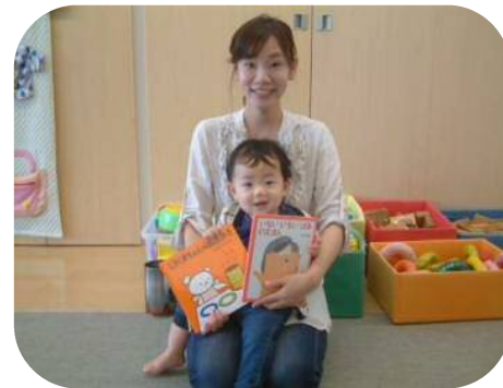
☆絵本の読み聞かせ☆ 素敵な2冊の絵本を紹介して いただきました！