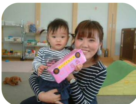
可愛いオリジナルのバスが完成～！