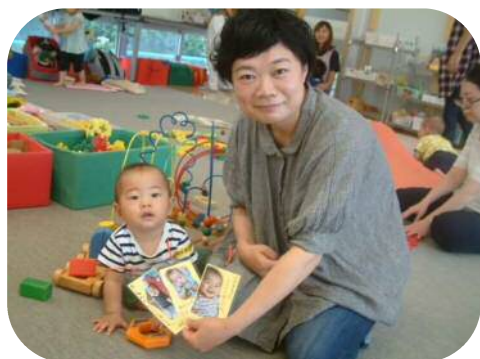
敬老の日のプレゼント作り☆ (*^_^*)

澄みきった青空や朝夕の風の冷たさに、秋の深まりを感じるようになりましたね。 体調管理に配慮しながら、寒さに負けずに元気いっぱい過ごしましょう！