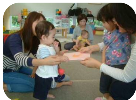
★9月の誕生会★ お友達から手形のプレゼント♡