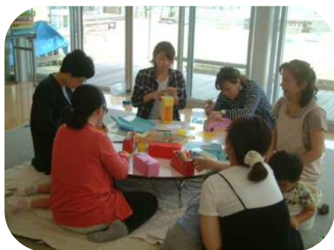
☆手作り玩具のつどい☆