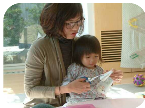
☆手作り玩具のつどい☆ お母さんと一緒にチョコチョコキ!