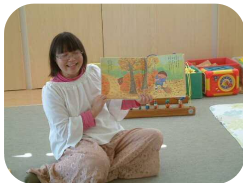
『骨盤底筋体操』 絵本セラピストの方も来て下さいました。