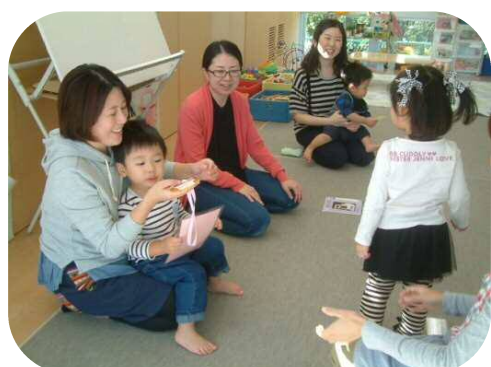
☆10月の誕生日会☆ おめでとうございます(*^_^*)

色鮮やかな紅葉の季節も終わり、少しずつ冬の訪れを感じますね。早いもので今年も残すところ後わずかになりました。今年最後の思い出にお楽しみ会を計画しています。皆さんと楽しい時間を一緒に過ごしましょう。