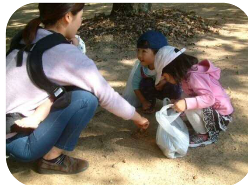
四十九台公園で・・・ 小さい秋、みつけた♪