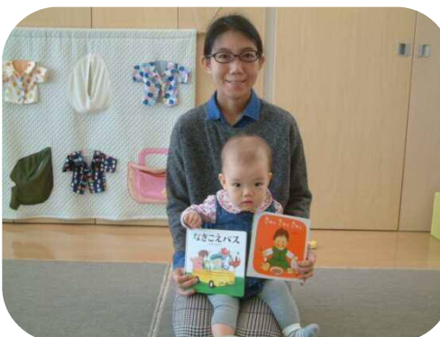
☆絵本の読み聞かせ☆