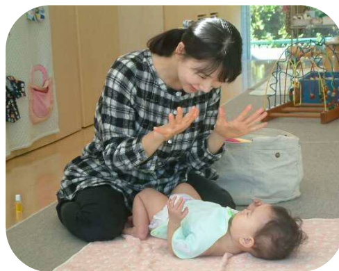
今からマッサージ始めるよ〜♪