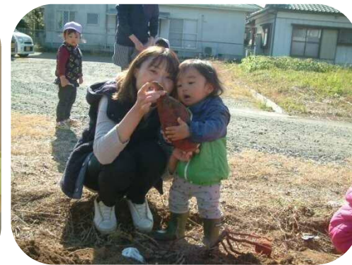
芋ほりをしました! 大きいお芋が掘れたよ〜!