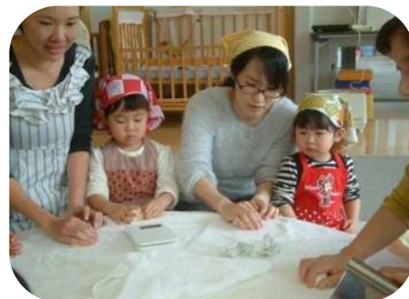
★エプロンくらぶ★ さつま芋パンを作ったよ♪