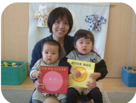
☆絵本の読み聞かせ☆