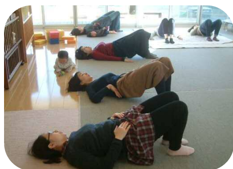
『骨盤底筋体操』 思いっきり体伸ばして、心も体もリフレッシュ!