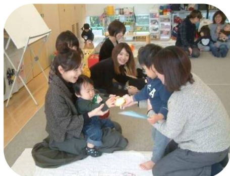
☆11月の誕生日会☆ おめでとうございます (*^_^*)

玉名市子育てネットワークは、おかげさまで24年目の春を迎えます。 メープル広場を、これからもたくさんの方との出会いや、つながりが出来る場所として利用していただけたら嬉しいです。