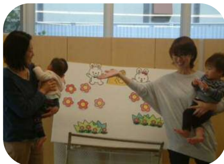
エプロンシアターでじゃんけん ぽん!