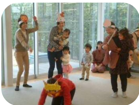
♪お楽しみ会♪劇や絵本やダンスに、大盛り上がり (^◇^)