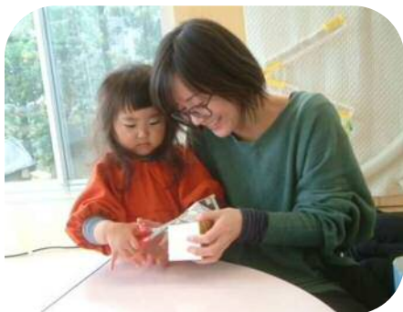
☆手作り玩具のつどい☆ 私もしたい!と積極的な姿も。