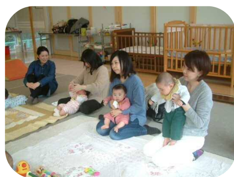
助産師さんをお交えての育児相談♪