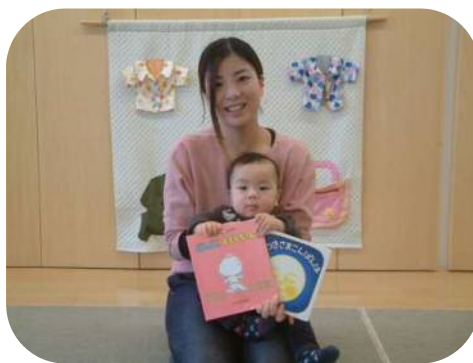
素敵な絵本を紹介して頂きました！