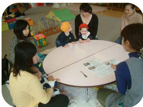
『0歳児親子のつどい』 離乳食相談☆