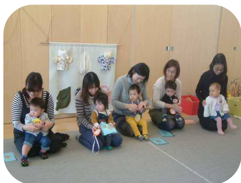
☆12月の誕生日会☆ 1歳を迎えたお友達です(*^_^*)

寒いが続いていますね。インフルエンザや風邪にかかる子ども達も増えてくる時期になりました。体調管理に気をつけ、この冬を元気に乗り切りましょう！今月は豆まきがあります。メープル広場にも鬼がやってきますので、みんなで豆をまいて鬼を退治しましょう。