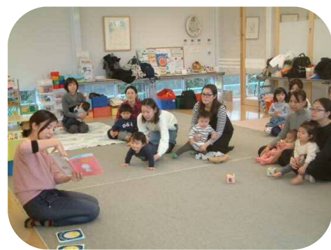
☆絵本の読み聞かせ☆