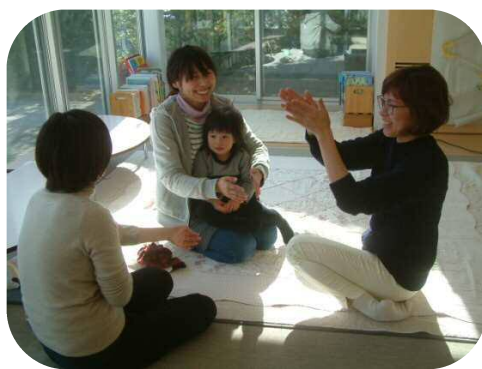
♪1歳児以上わらべうた♪