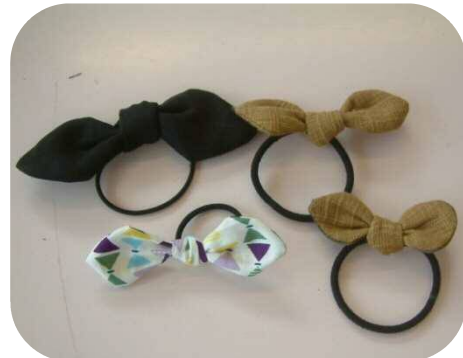
お子さんとお揃いのゴムの完成～♪