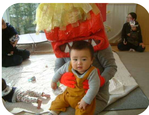
豆まき☆鬼さんとハイ!ポーズ!