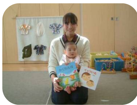
☆絵本の読み聞かせ☆