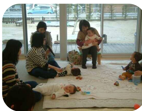
『0歳児親子のつどい』