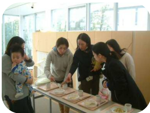
『0歳児親子のつどい』 離乳食の展示☆