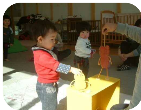
1歳児以上わらべうた♪