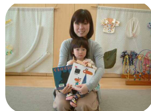
『絵本の読み聞かせ』