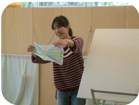
☆3月の誕生会☆ パネルシアターのプレゼント♡