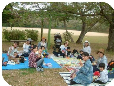
♡四十九台公園でお花見♡