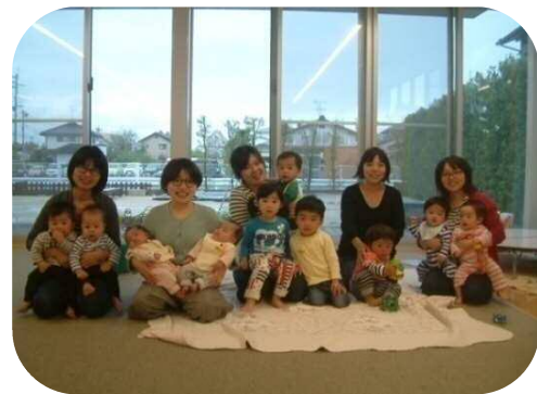
ピースくらぶ☆ 双子ちゃん大集合～！