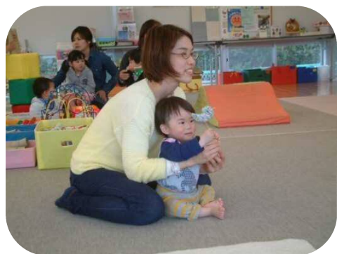
手作りのこたまりを使い、わらべうたで遊びました♪

園庭の木々にもやわらかな若葉が見られるようになりました。今月は、ご家庭で遊べる玩具を作ったり、親子で楽しめるプログラム等を用意しておりますので、ぜひお気軽にお出かけ下さい。