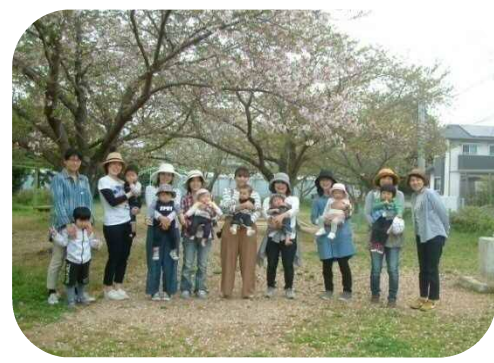
♪みんなでハイチーズ♪