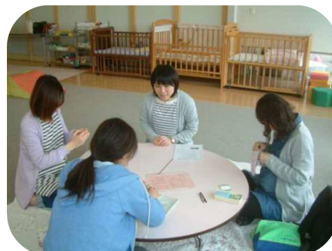
ポコポコくらぶ☆ 赤ちゃんに早く会いたいなあ…