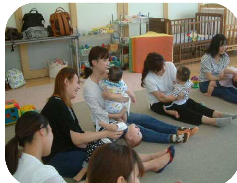
0歳児わらべうたのつどい