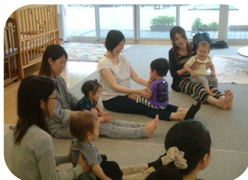
1歳児以上わらべうたのつどい