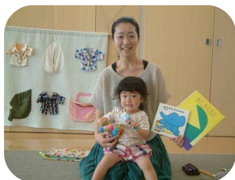
☆5月の絵本の読み聞かせ☆ 素敵な絵本を紹介して頂きました

梅雨明けが待ち遠しいですね。これから暑くなり、子ども達も体力を消耗しやすくなります。しっかりと水分補給をしながら休息をとるようにしたいですね。プールも開放してまいりますので、体調管理に気をつけて夏の遊びを楽しみましょう♪