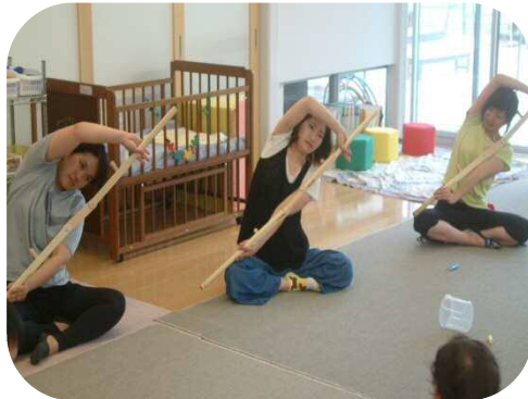
《からだバー》 身体動かしてリフレッシュ!