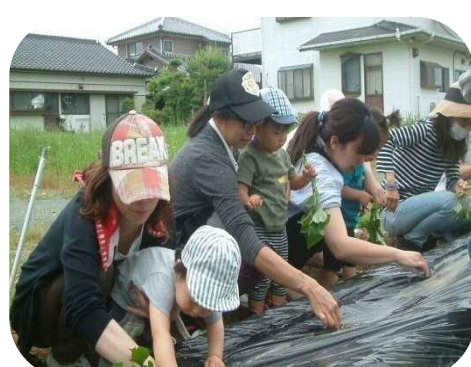
♪芋の苗植え♪ 早く大きくなぁ〜れ!