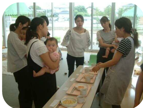
《0歳児親子のつどい》 離乳食の展示☆