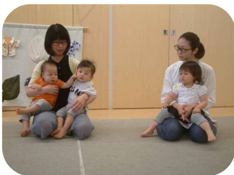
♪5月の誕生会♪ お誕生日おめでとう〜!