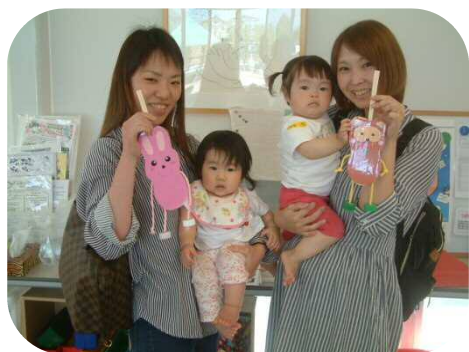
《割りばし人形作り》 かわいく出来ました♡