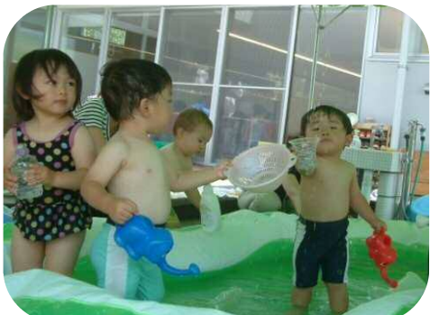
水遊びを満喫中!! 冷たくて気持ち良いな☆