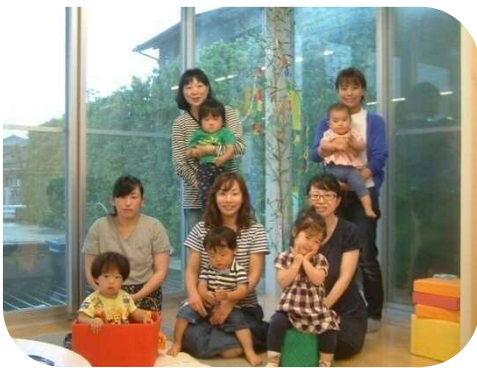
☆七夕の飾り付け☆ 短冊にお願い事を書いて飾りました。

日中はまだまだ暑い日が続き、子ども達の水遊びが気持ちよさそうです。これからの季節、赤トンボがとんだりコオロギが鳴いたり、秋を感じる季節になりますね。朝夕と日中との気温差で体調を崩さないように気をつけましょう。