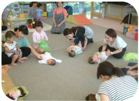
《0歳児わらべうた》 お母さんと一緒にわらべうた遊び