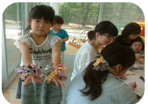
かわいいハギレを使って シュシュを作りました(^o^)