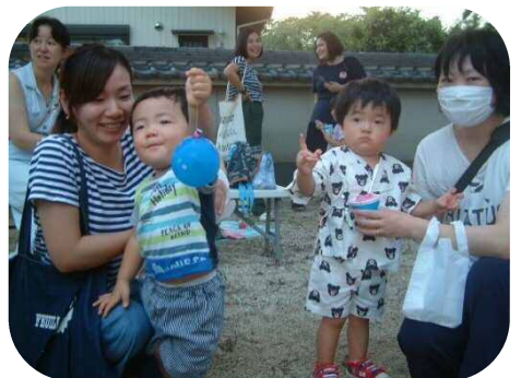
敬愛保育園の盆踊り会に参加しました♪