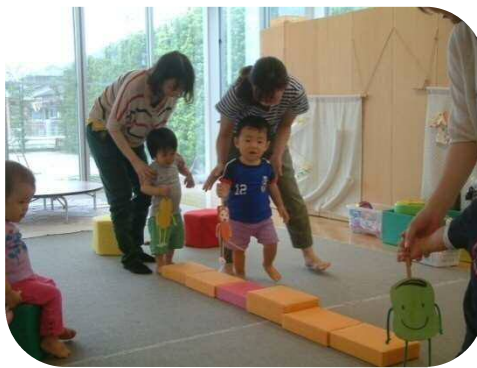
《1歳児以上のわらべうた》 《りさ先生のからだバー-de ママメクス》 どんどんばし渡れ~さあ渡れ~♪ 身体ほぐれて良い汗かいてます♪