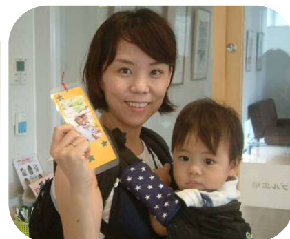
《敬老の日のプレゼント作り》 オリジナルのしおりを作りました