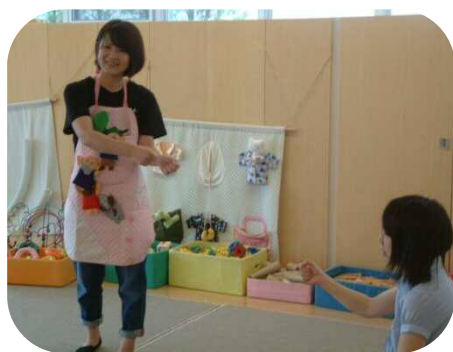
《お誕生会》 『大きなかぶ』のエプロンシアター

涼しい風が吹いて過ごしやすくなりましたね。外遊びが気持ちの良い季節です。 散歩に出かけたり、木の実や落ち葉など秋の自然を一緒に見つけに行きましょう！