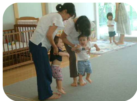
《0歳わらべうたのつどい》 アシアシアヒル♪