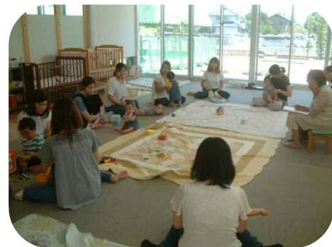
《0歳児親子のつどい》 助産師さんへの育児相談・身体測定