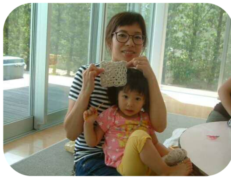
《かぎあみをしよう》 かわいい小物が完成しました！