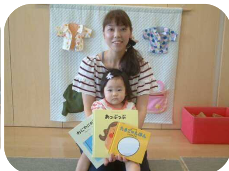
《絵本の読み聞かせ》 3冊の絵本を紹介して頂きました