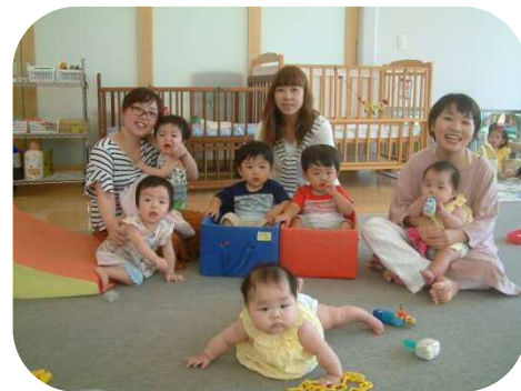
《ピースくらぶ》 双子ちゃんあつまれ〜♪