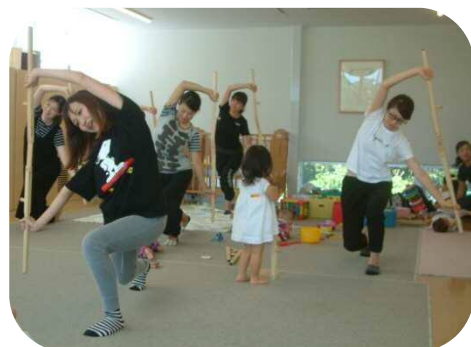
《りさ先生のからだバーde ママ美クス》