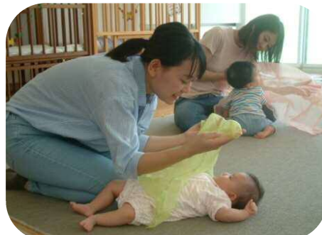
いないいないばあ〜！