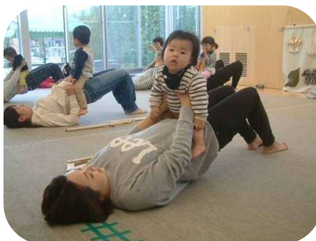
《からだバーでママビクス☆》 親子ストレッチも楽しみました