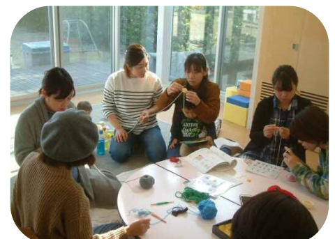
《かざあみをしよう♪》