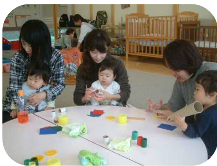
《手作りおもちゃ》 ひも通しを作りました♪