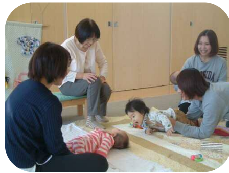
《0歳児親子のつどい》 助産師さんへの育児相談・身体測定