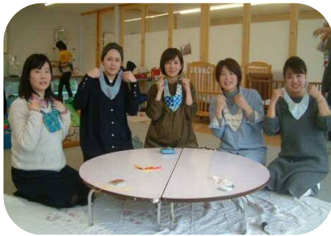
《ポコポコくらぶ》 おしゃべりしながら かわいいスタイの完成♪

玉名市子育てネットワークは、おかげさまで25年目の春を迎えます。 メープル広場を、これからもたくさんの方との出会いや、つながりが出来る場所として 利用していただけただら嬉しいです。