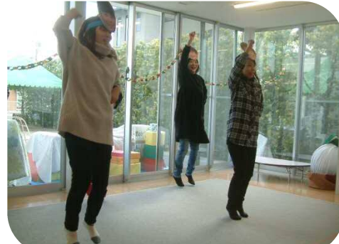
《☆お楽しみ会☆》 歌って！踊って！参加された親子さんみんな楽しみました！