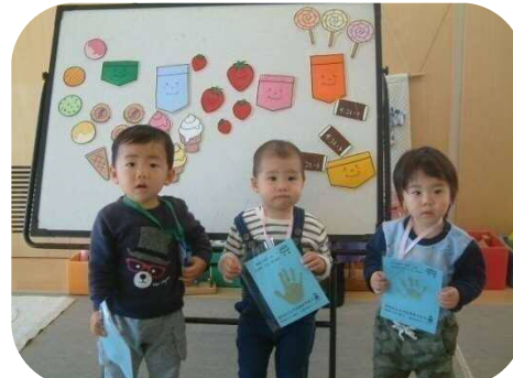
《☆11月生まれのお誕生会☆》