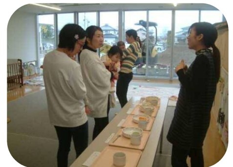
《0歳児親子のつどい》 離乳食の展示