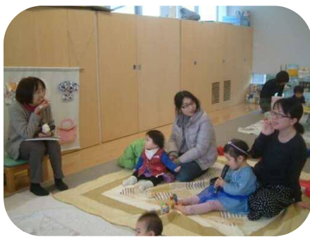
《0歳児親子のつどい》 助産師さんへの育児相談・身体測定

木々の芽が膨らみ、寒さの中にも春の訪れを感じるようになりました。戸外遊びも気持ちよくなる季節になりましたね。今月も入園お祝い会やお花見など、楽しいプログラムを計画しておりますので、ぜひお出かけください♪