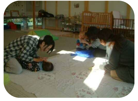
《0歳児わらべうたのつどい》