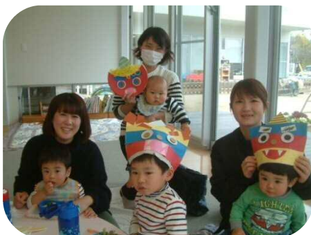
《鬼のお面作り☆豆まき》