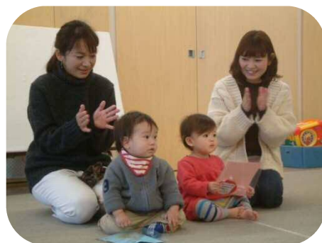
《1月のお誕生会》 みんなでお祝いしました♪