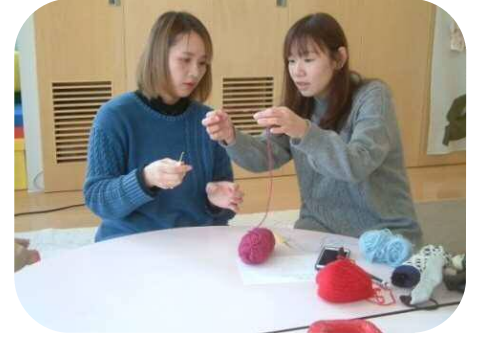
《かぎあみをしよう》 何が出来上がるか楽しみです☆