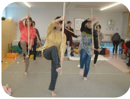
《☆からだバーde ママ美クス☆》