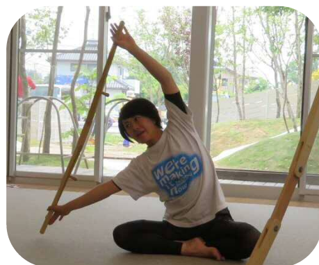
からだバーを使ってストレッチ♪