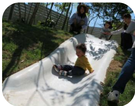
☆園庭開放☆ すべり台や砂場で遊んだよ！