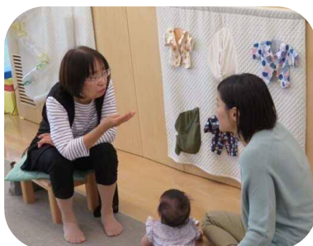
助産師さんへの育児相談、身体測定