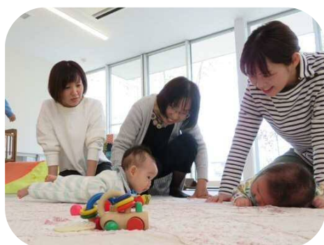
《0歳児親子のつどい》