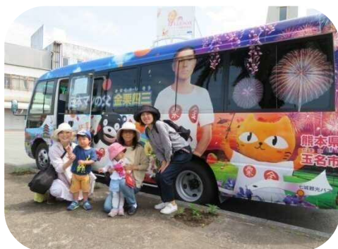
玉名駅から金栗四三周遊バスに乗って、小田地区へ行きました！