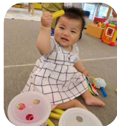
お母さん手作りのホース落とし☆