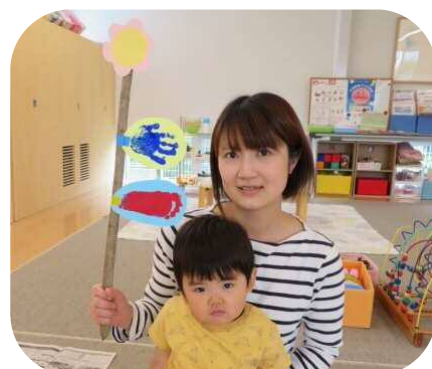
こいのぼりを作ったよ♪