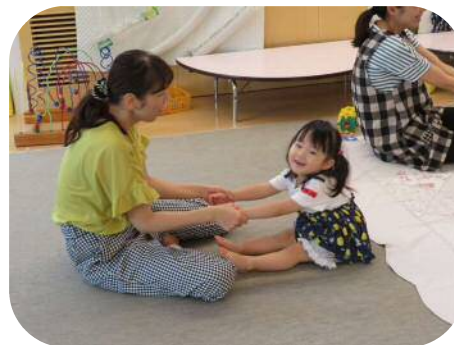
お母さんと一緒にわらべうた♪ 『オフネガギッチラコ』