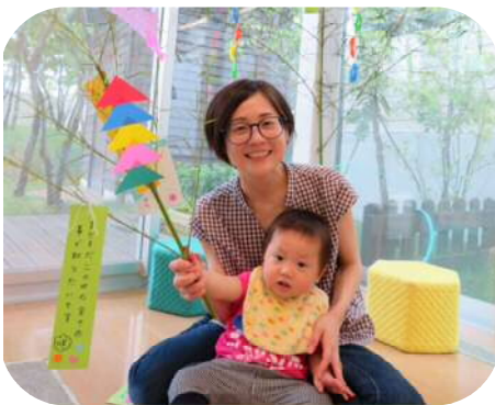
お願い事かないますように☆