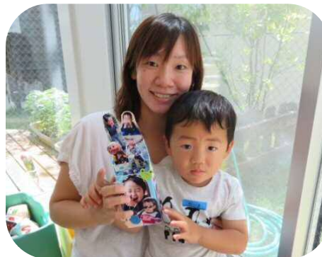
写真を貼って、オリジナルのペン立てを作りました！