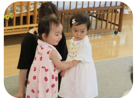
お友達にもわらべうた♪ 『にゅーめんそーめん』