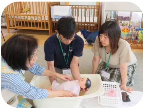
《プレパパ・プレママ学級》 妊婦疑似体験や沐浴指導がありました。

梅雨明けとともに、本格的な夏がやってきます。水分と休息をこまめに取りながら、水遊びなど夏ならではの遊びを楽しみましょう！