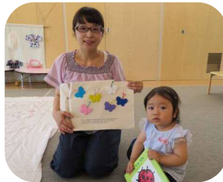
《誕生会》布の紙芝居で歌いながらお話をして下さいました♪