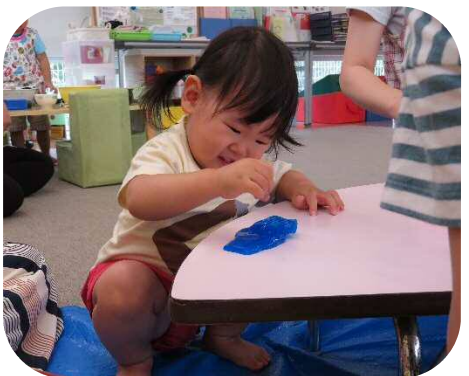
☆スライムで遊ぼう☆