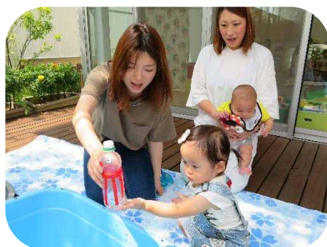
手作りのペットボトルシャワーで水遊び♪