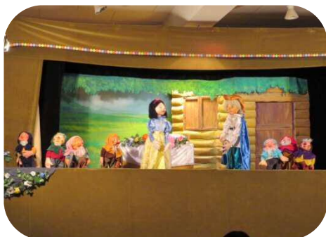
☆人形芝居かすべる☆ 「白雪姫とゆかいな七人の小人達」