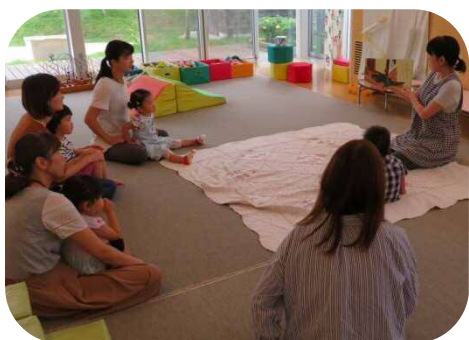
☆絵本の読み聞かせ☆

セミの大合唱が響き渡っていますね。まだまだ暑い日が続きますが、水遊びで汗を流し、水分と休息をこまめに取りながら、気持ち良く夏ならではの遊びを楽しみましょう！