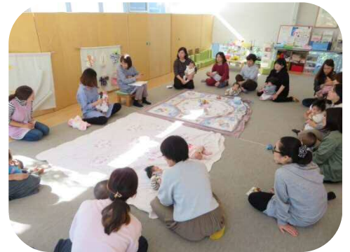
0歳児親子のつどい