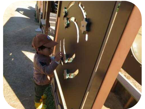
面白いおもちゃ発見♪