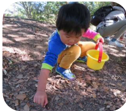
どんぐり見つけた！！