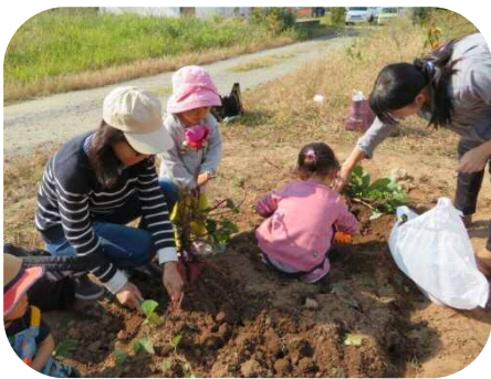
うんとこしょ、どっこいしょ

園庭の木々の葉もすっかり落ちて、寒そうにたたずんでいます。少しずつ冬の訪れを感じますね。あっという間に、令和元年も残りわずかになりました。今年最後の思い出にお楽しみ会を計画しています。皆さんと楽しい時間を一緒に過ごしましょう。