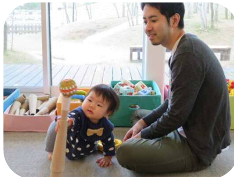
お父さんと一緒に♡