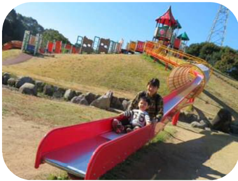
諏訪公園で遊んだよ！！