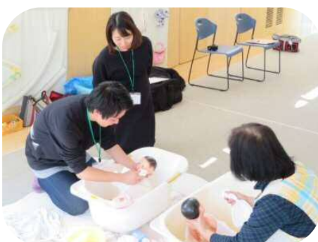
☆プレパパ・プレママ学級☆