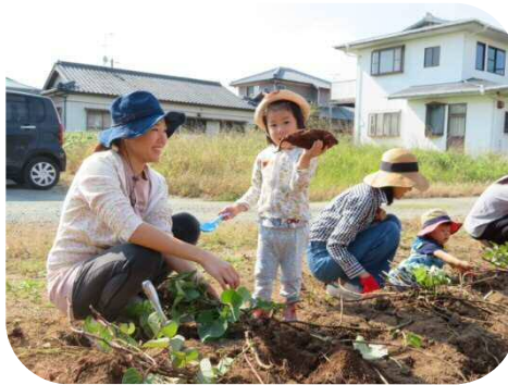
大きいお芋掘れたよ♪