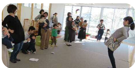
ちょっとだけ体操で、心もからだもほぐし♪まだまだ反って～！