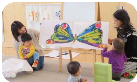
はらぺこあおむしの大型絵本 心地よい音楽が流れ、寝ちゃう子も…