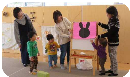
シルエットクイズ☆なーんでしょ？