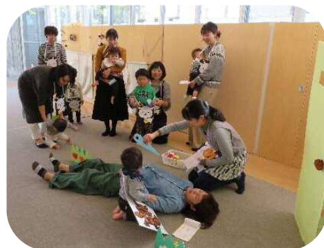
☆熊本弁バージョン おおかみと七ひきのこやぎ☆ ぶっつけ本番！ドキドキ…のお母さん達