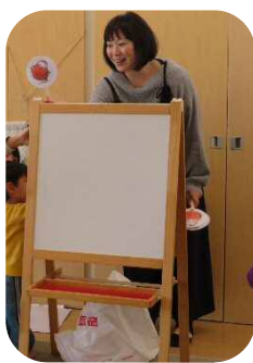
大好きな絵本♥ 『だ・る・ま・さ・ん・が』