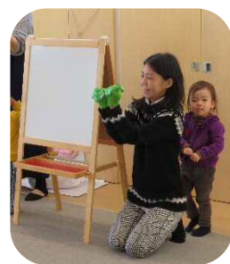
きゃべつーのなかかーら♪ みんな歌っていました♪